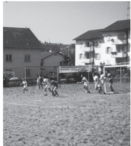
In den ersten 14 Jahren wurde auf dem schrägen Platz gekickt.