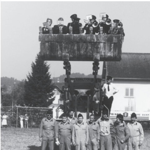
Ein seltenes Bild: Trockenes Wetter beim Plauschspiel Musikgesellschaft - Feuerwehr.