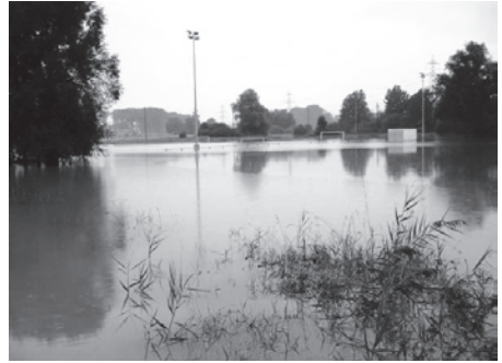
Katastrophe und Idylle zugleich: Ein Blick aufs Reussfeld nach dem Hochwasser 2005.