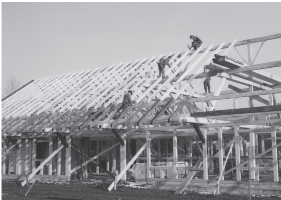
Die eindrückliche Holzkonstruktion nimmt Formen an.